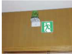
2) Ở cửa ra vào có đèn màu xanh để làm gì?