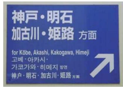
9) bảng chỉ dẫn nhiều thứ tiếng [ Ai sẽ dùng dễ dàng hơn? ]