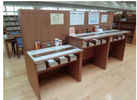
6) Bộ để viết [ tại sao chiều cao khác nhau? ]