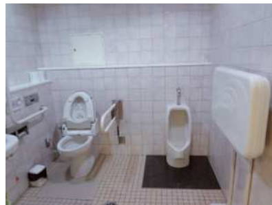
8) Nhà vệ sinh [ đối với ai sẽ dùng dễ dàng nhất? ]