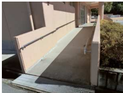
7) dây cáp treo [ dễ dàng hơn dành cho ai? ]