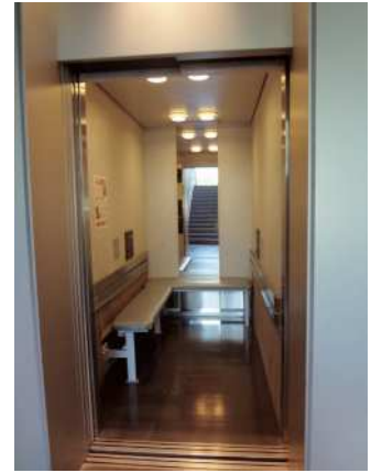
4) Thang máy [ khác nhau ở chỗ nào? ]