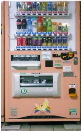
1) Máy bán hàng tự động [ khác nhau chỗ nào? ]

Xung quanh chúng ta, mọi người có nghĩ ra nhiều điều gọi là [ ôn hòa ]. Ở đâu, sẽ có cái [ ôn hòa ] như thế nào, chúng ta hãy tìm kiếm xem.