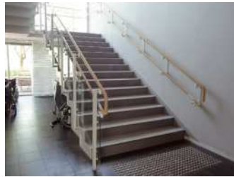
3) Tay cầm cầu thang [ tại sao lại có 2 ống? ]